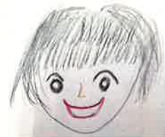
M.Mさん (就労継続支援B型)