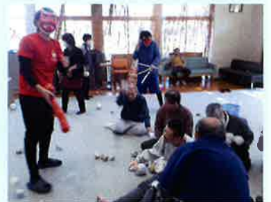
今年の豆まきは「倍倍ファイト!」。豆の大きさも量もいつもの倍で、鬼も必死に逃げ回るほどの大盛り上がりでした。