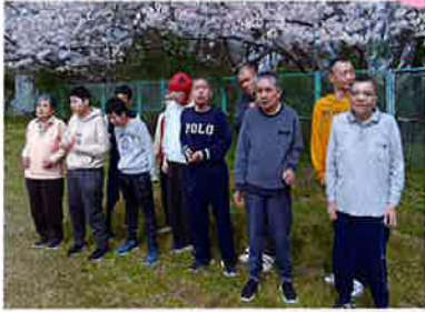
今年もきれいな桜が咲いたよ!