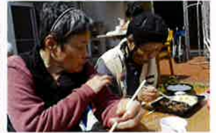
満濃森林公園へ花見外出に行きました。桜がとても美しく、春の訪れを感じながら心も体もリフレッシュできるひとときとなりました。園では花見弁当を味わいました。