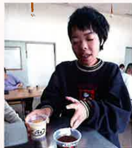
2種類のプリン。チョコとプレーン、どっちにしようかな?!じっくりと考えて選びました。どちらも甘くて美味しかったです。