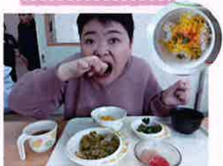
行事食のバラ寿司が美味しくて、大きなお口でパクッと頂きました。