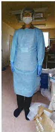
防護服。着替える手順が重要です！