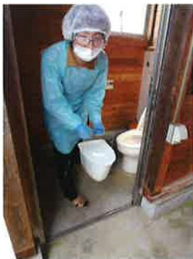
排泄物を専用のトイレに流し、洗います。

訓練を実施して、感染していない利用者さんを守りつつ、感染している利用者さんにどのように食事を提供するか、ルート管理や衣服の洗濯方法、排泄物の処理、支援するスタッフの感染防止のための防護服の着脱の手順など課題がたくさんありました。