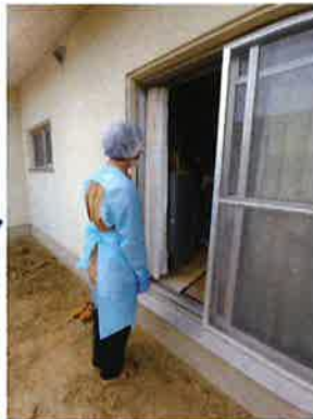
利用者さんから、食事後のトレーやポータブルトイレのバケツを受け取ります。