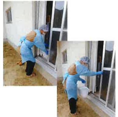
これはポータブルトイレのバケツを受け取るシーン