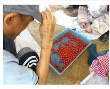
室外活動班で 大事に育てている野菜