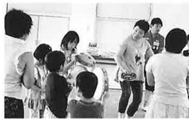
余暇教室 音楽療法 親子9組参加 (7/22)