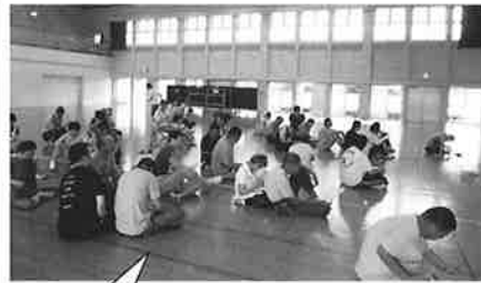
歌詞を見ながらみんなで歌いました。

2人の先生方をお迎えして皆で楽しい一時を過ごしています。毎月の季節を感じられる歌を中心に、夏は「七夕」「青葉城恋歌」などを歌いました。また、「さんぽ」を手話を使って歌ったりと体を動かしながら楽しんでいきます。