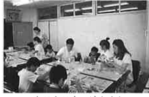
キラキラもつけたよ!