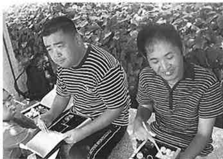
『みんなで食べるとおいしいね』