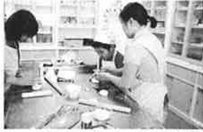
ハートのパンもおいしかった♡