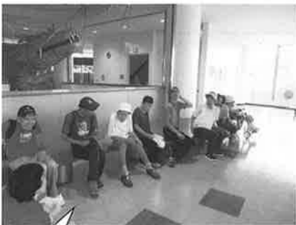
ちょっとひと休み!

公園に着くと皆でおいしいお弁当を食べ、園内を散策したあとに水の資料館という施設を見学しました。香川県の気候について、香川用水の必要性について等、模型で分かりやすく展示されていました。また、水の体験コーナーも設置されており、水車を動かすと音が鳴る装置で遊んだりしました。天候にも恵まれ、良き外出日和となりました。