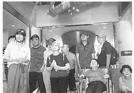
最後に記念写真。ハイチーズ!!