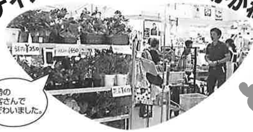
大勢のお客さんでにぎわいました。

8月22日(金)～24日(日)、ゆめタウン高松で、ナイスハートバザール in かがわが開催されました。ふじみ園からはスラッシュキルトや正座イスなどの縫製品、花苗や花力ゴなどの園芸品が人気でした。 いろいろな方が丁寧な仕上げや安さを誉めてくださり、たくさんお買い上げいただきました。ありがとうございます。