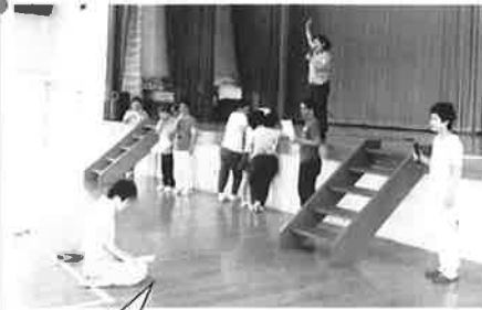
先生と一緒にうたいましょう!