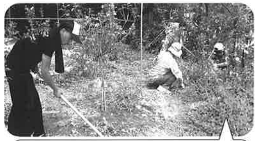
庭の除草作業を行っています

施設外就労とは、「利用者」と職員がユニットを組み企業から請け負った作業を当該企業で行う支援」と定義されています。当園では平成25年10月より2回、特別養護老人ホームで除草、環境整備、庭木の剪定及び庭の清掃など請け負い実施しています。