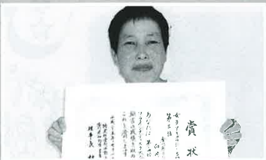
3位入賞 おめでとう!!