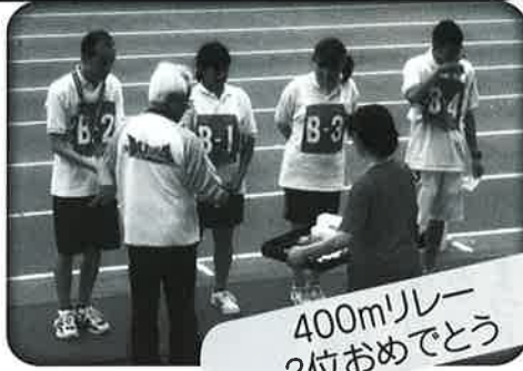
400mリレー 2位おめでとう

走などトラック競技と、フライングディスクなどのフィールド種目に参加して力を発揮しました。当日は競技の進行について天気も回復し、応援席に、メダルや賞品を持ち帰ると、共に喜び合って秋の一日を楽しみました。