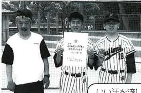
いい汗を流しました

「疲れたー。」と言いながらもとても楽しかったようで、次回も「出場したい。」と話していました。