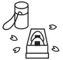
＼おいしくいただきました／