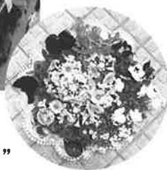
“ひと足早く春の気分で!!”