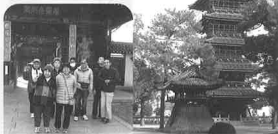
一外出や外食で、ひと時のリフレッシュー