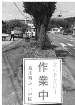
きれいになったよ!

ゴミは、タバコの吸ガラや、空缶が多かったです。通りかかった時は、どうぞ利用者さんの頑張った様子を思いえがいて下さい。