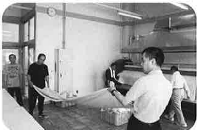
シワにならないよう丁寧に仕上げます

今回の大会では、皆さん怪我もなく、楽しんでプレーする事が出来て良かったです。ソフトボールは残念ながら勝つ事は出来ませんが、随所で、フラインプレーがあつたり、大きなあたりを出して頑張った選手たち。会場も大盛り上がりで楽しい大会となりました。