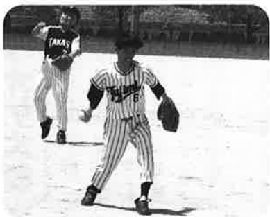
良い汗をかきました!

ゴミは、タバコの吸ガラや、空缶が多かったです。通りかかった時は、どうぞ利用者さんの頑張った様子を思いえがいて下さい。