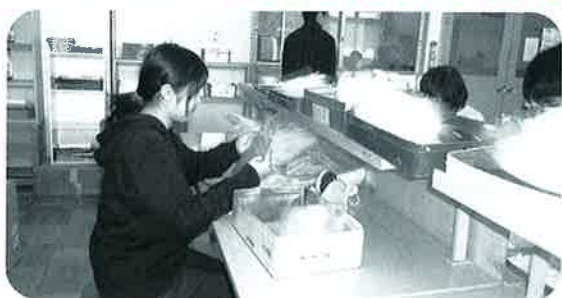
軽作業班にて作業中