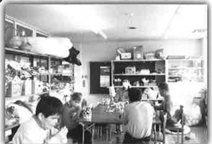
おおぞらA軽作業班