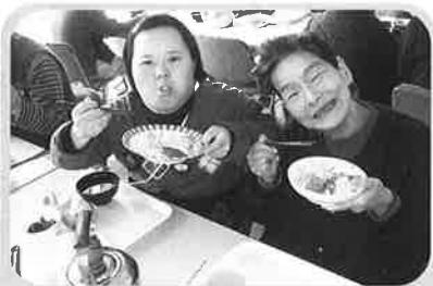
ほっぺたがおちそう♡

当日は調理員さんが、目の前でお寿司を握ってくれて、お寿司屋さん気分も味わいました。