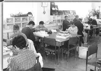
おおぞらB軽作業班

スプリングフェスタ等に向けておおぞらAとBの軽作業班は、製品作りががんばっています。気に入ってくれると、うれしいです。