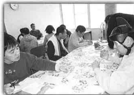
うるおい学習活動

うるおい学習活動では、今年もたくさんの方のアイデアを出して、すてきな作品を作っています。と思っています。