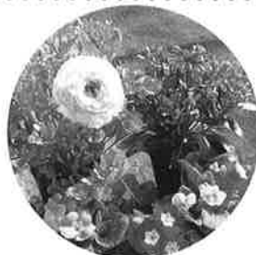
ランシキユラス、オステオスペルマム、プリムラ

3月は保育所、幼稚園の卒業式を飾る花々の出荷に追われた月でした。 みなさんも、春を迎えて花を植えてみてはいかがでしょうか。当園のログハウスなどで販売しています。