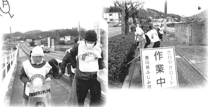
生け垣の中の草を取り、道路に落ちているゴミを集めてゴミ袋に入れていきます。