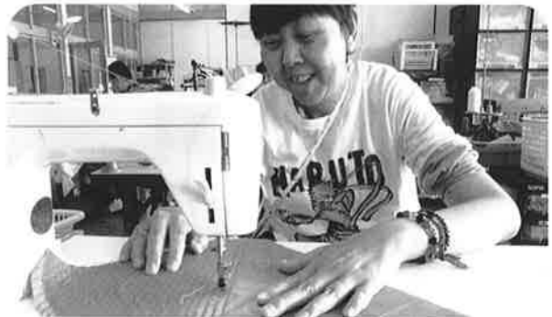
普段の作業風景です 幅をそろえて縫っています