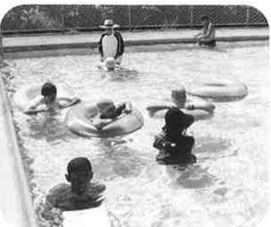
7月から8月にかけて当園のプールが開かれました。暑い夏は、冷たい水に入ると、とても気持ちがいいです。

運動にもなり、一石二鳥。利用者さんも職員もまっ黒に日やけて、元気にプールを楽しみました。