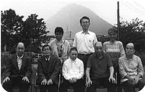
(塩田園長と一緒に記念撮影)