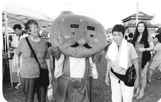
(丸亀名物ほねつきじゅうじゅうといっしょに)

毎年この日に行われていますが、今年は40年目ということで、記念式典の他、ステージも丸亀城バサラ京極隊や、鴨川福祉太鼓などが披露されました。参加した利用者さんも大満足でした。