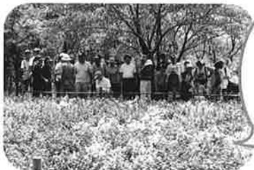
公洲公園 あつくてもお花は元気がいいなあ (おおぞらA)

おおぞらでは、色々なところに外出をして、たくさんの体験をしてもらおうと、毎回計画を練っています。