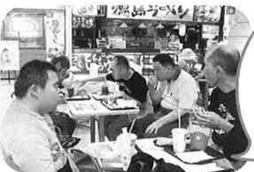
買物の後の食事はとってもおいしいね♡ (おおぞらB)