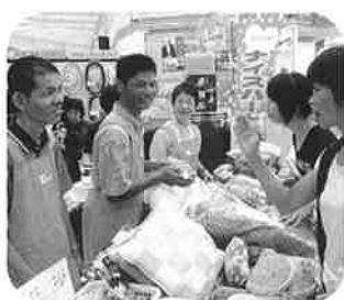
(ナイスハートは初めてなので緊張しました)

目の前で自分達の作った商品を、お客様が喜んで買っていかれる様子を見て、また明日からの作業意欲が高まったことと思います。