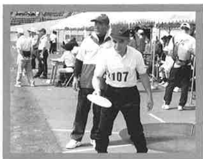
(精一杯頑張りました)

選手総勢928名中、ふじみ園からは23名の選手が50m、200m、400m走や立幅跳や走幅跳、ソフトボール投やフライングディスクと様々な競技に参