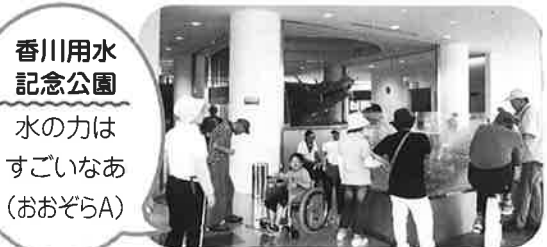
香川用水記念公園 水の力はすごいなあ (おおぞらA)