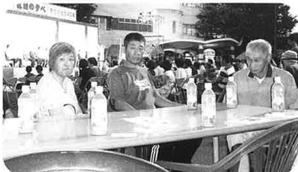
(打ち上げ花火も楽しみです)